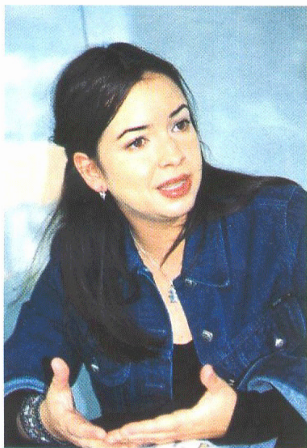
Bermúdez: La migración responde a un clamor